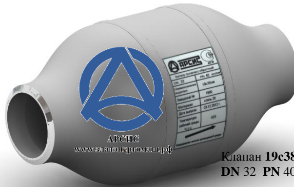
Клапан 19с38нж DN 32 PN 40

гарантирует долговечность и безотказную работу изделия.