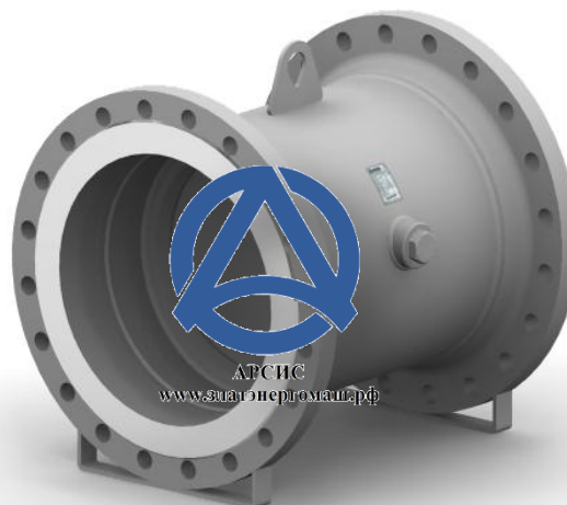
Клапан 19с49нж DN 500 PN 25

Клапан 19с49нж имеет схожую внутреннюю конструкцию с 19с47нж. Все отличие заключается в увеличенном диаметре и как следствие, в уменьшенном размере противовеса. Это связано, прежде всего, с тем, что данный клапан имеет большие габариты и, следовательно, диск (захлопка) имеет самодостаточную силу для прижатия к седлу, что обеспечивает необходимую герметичность клапана.